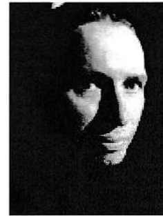
Michel de Ghelderode